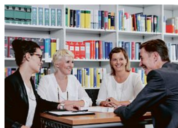
Kommunikation spielt bei WSS eine große Rolle.

Neben der Auszeichnung »Great Place to Work« hat die Kanzlei auch beim Wettbewerb »Top-Steuerberater 2018« des Handelsblatts sehr gut abgeschnitten und ist 2018 auf der Liste der Top-Steuerberater Deutschlands zu finden. Für die WSS AKTIV BERATEN zum einen natürlich eine Bestätigung der täglichen Arbeit. Zum anderen aber auch Antrieb, sich diese Auszeichnung jeden Tag auf's Neue zu verdienen.